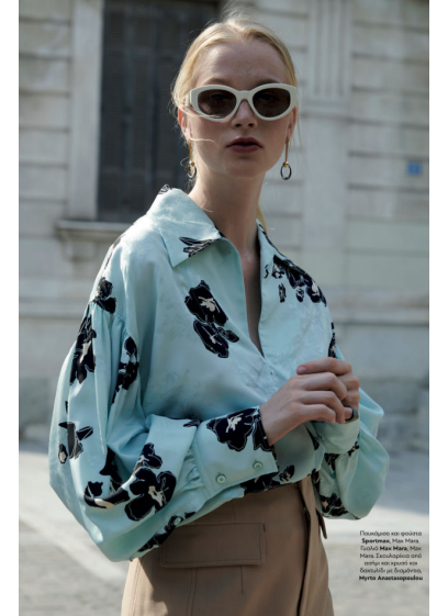
Προσώπων: από στίβος: Zsófia, στίβος: Zsófia, United Colors of Benetton. Στοιχείο: από online και Designer: Annette Kramar, Venezia